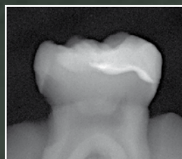
Nieprzepuszczalność dla promieni rentgenowskich